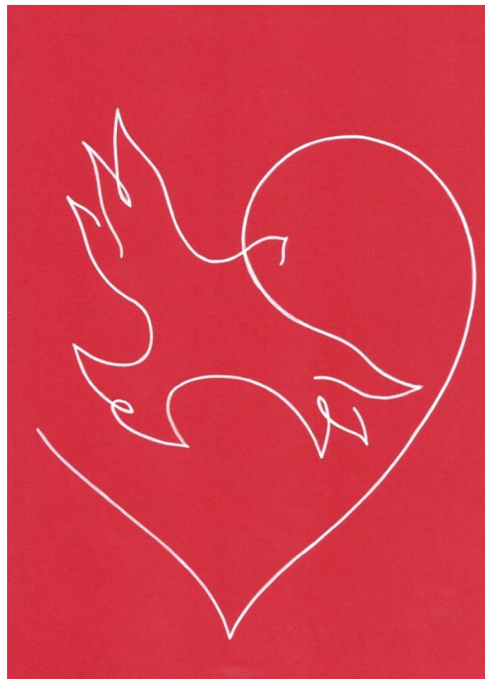
Szív és lélek

Lélek-fénnyel árad lelkem Szív-felhőben gyűlik könnyem S míg boldog-fájón földre ejtem Lelkedbe feledkezem.